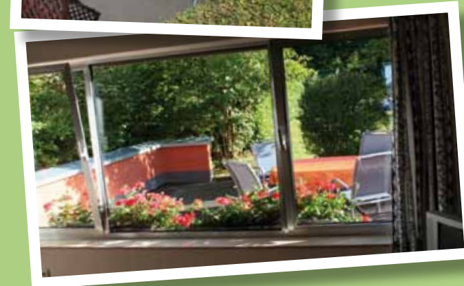
Aussen warm und ruhig in den Süden