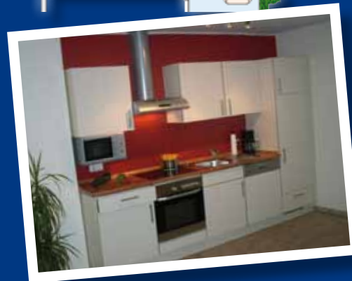
Innen groß, hell und modern