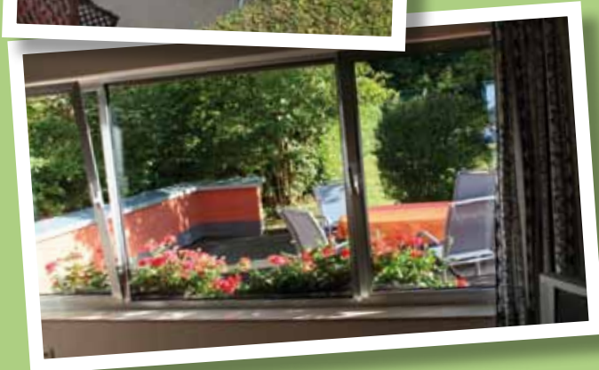
Aussen warm und ruhig in den Süden